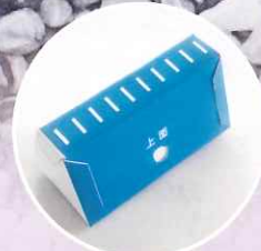
組立式ハンマーヘッド ノズル付き