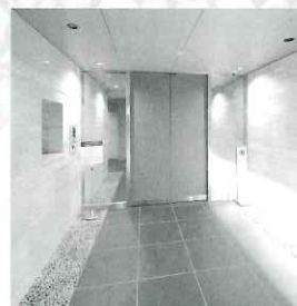
マンションのエントランス